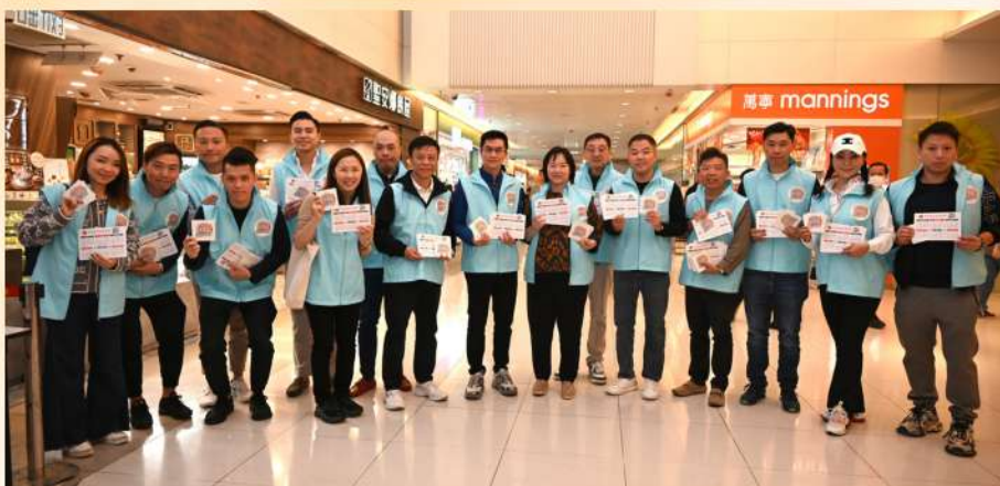
我們到30多個不同地區的街站及商場，呼籲選民在第七屆區議會選舉中踴躍投票。