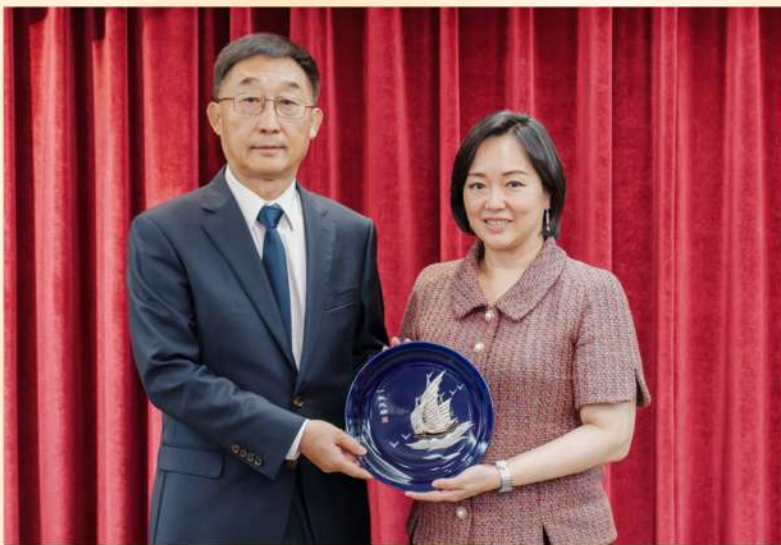
廣西壯族自治區黨委書記劉寧帶領廣西黨政代表團慰問香港廣西社團總會，並出席了重點商協會及企業座談會，共同探討桂港合作機遇。