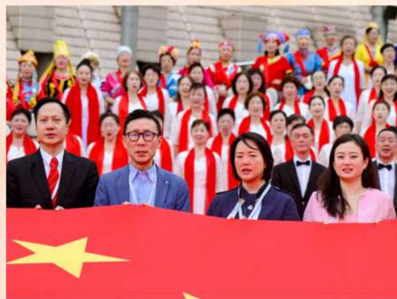
在維港舉辦「幸福唱中國」千人交響大合唱活動，慶祝新中國75周年華誕。