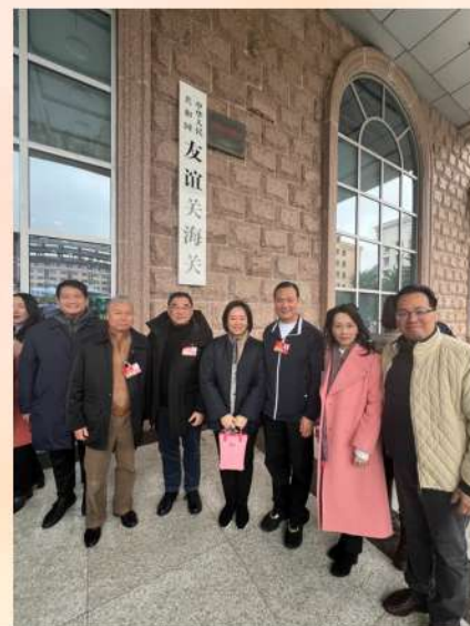
與自治區政協港澳委員考察友誼關愛國主義教育研學基地。