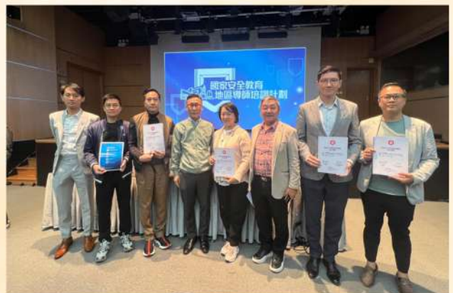
獲委任為國家安全教育地區導師，一同向社區推廣國安觀念：維護國家安全，人人有責、人人盡責。