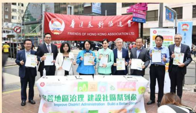
宣傳完善地區治理方案，呼籲市民聯署支持。