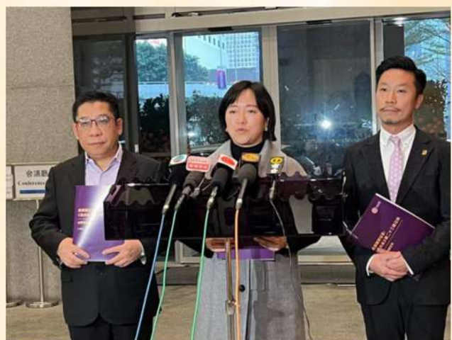
我們參與基本法第23條立法公眾諮詢，並透過傳媒講述立法必要性。