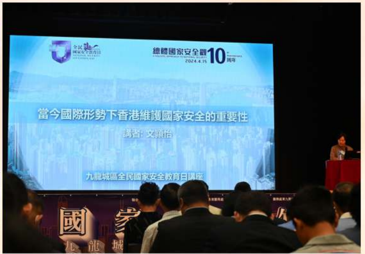
在全民國家安全教育日向居民及地區人士講述「總體國家安全觀」概念。