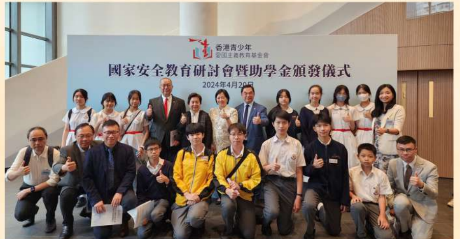
我們推動青少年了解自己肩負維護國家安全的責任，同時籌募助學金，豐富基層學生的學習經歷。