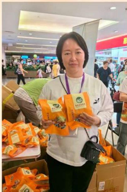
佳節送暖，分享喜悅。

地區服務已經成為我們的恆常工作，凝聚社區就是建設家園。讓我們與新一屆區議會、關愛隊和「三會」成員緊密合作，一同成為居民街坊的「貼心人」，與政府的地區服務相輔相成，及時了解基層的所盼、所需，令支援服務更高效到位。