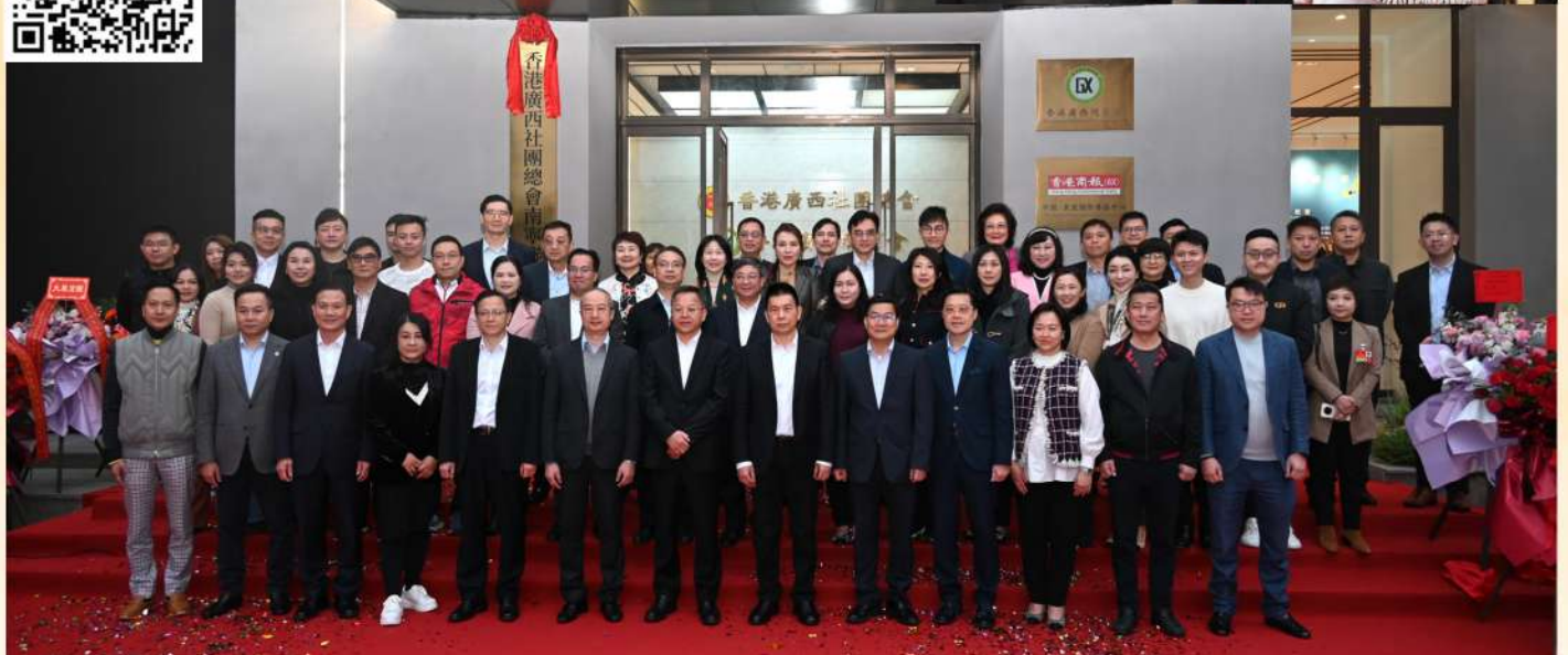
今年初，香港廣西社團總會於南寧開設聯絡處，為本會會員、在桂港人和企業提供聯絡點。