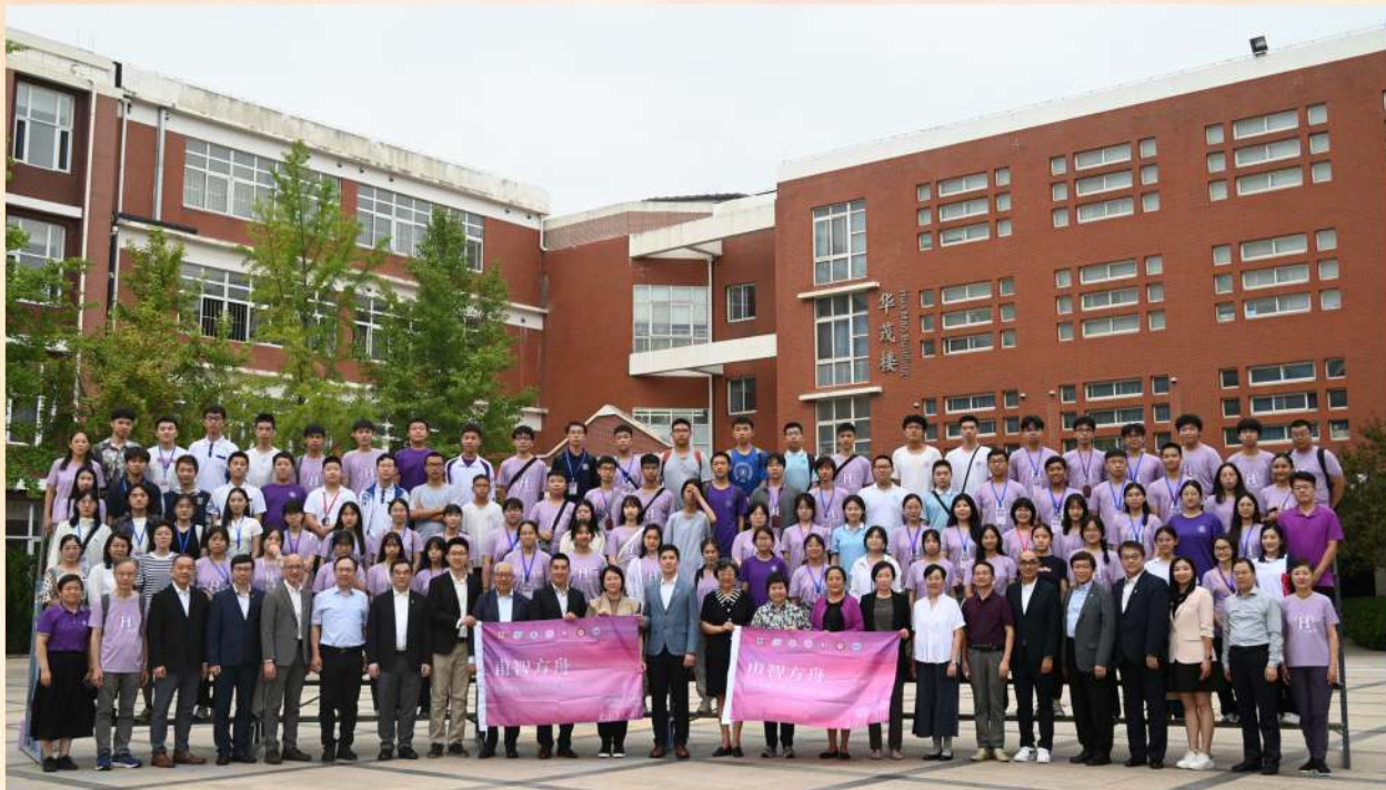
參與「甫智方舟2024」支教活動，與香港中學生到北京清華大學附屬中學參觀交流。

拳拳赤子心，殷殷家國情。熱愛祖國是新時代中國青年的立身之本、成才之基，要培育未來棟樑首先要培養學生的愛國情懷。我們會持續促進內地與香港的學校開展合作項目，以及舉辦新穎有趣的愛國主義教育活動，強化年輕一代與祖國的情感連結。