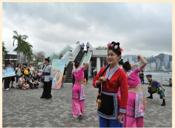
「廣西三月三」走進港澳系列活動規模不斷擴大，今年我們更在景區和社區進行廣西少數民族的特色表演。