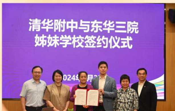
感恩能夠推動東華三院與清華大學附屬中學簽訂姊妹學校合作協議，為雙方學生日後交流奠定基礎。