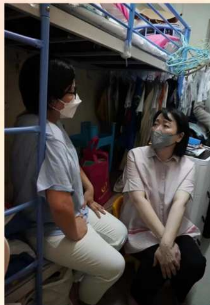
探訪基層，傳遞民聲。