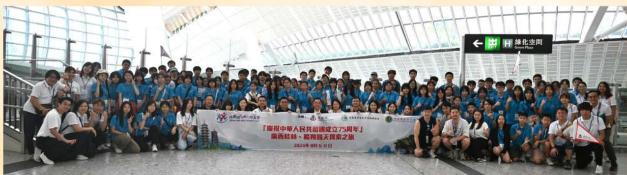
我們與「共創明Teen同學會」、東華三院陪同逾100名香港師生於8月考察桂林、陽朔。