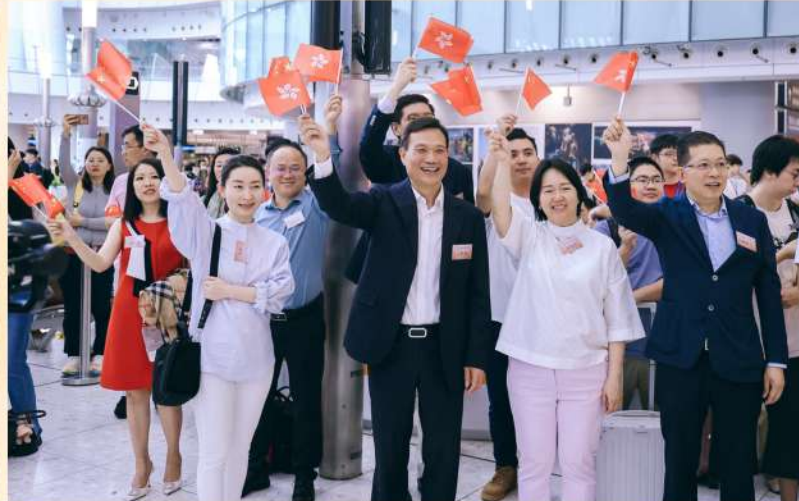
與香港青年愛樂樂團在香港西九龍高鐵站舉辦快閃交響音樂會，齊賀香港回歸祖國27周年。