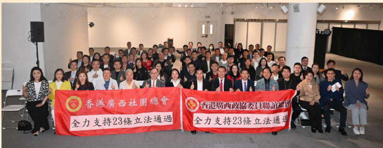
香港廣西社團總會全力支持特區政府就基本法第23條的立法工作。

經歷過2019年的港版「顏色革命」，我們明白到國家安全風險真實存在而且可以突如其來，唯有時刻保持警惕，才能保護我們所珍惜的一切。在特區政府開展基本法第23條諮詢工作期間，我向傳媒及在網絡平台講解立法的必要性，並在社區講解習近平主席提出的「總體國家安全觀」重大戰略思想，希望大家一同了解當今國際形勢下香港維護國家安全的重要性，共同肩負保障香港長治久安、繁榮穩定的責任，譜寫萬事興的新篇章。