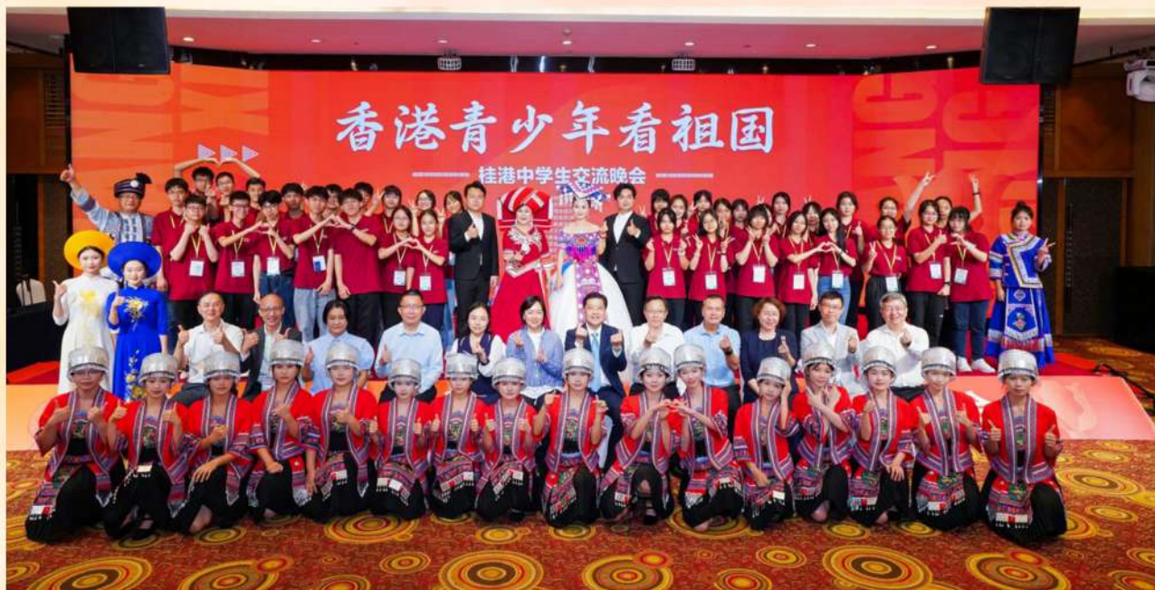
今年5月在南寧舉辦的「香港青少年看祖國 桂港中學生交流晚會」，逾50名香港師生參與。