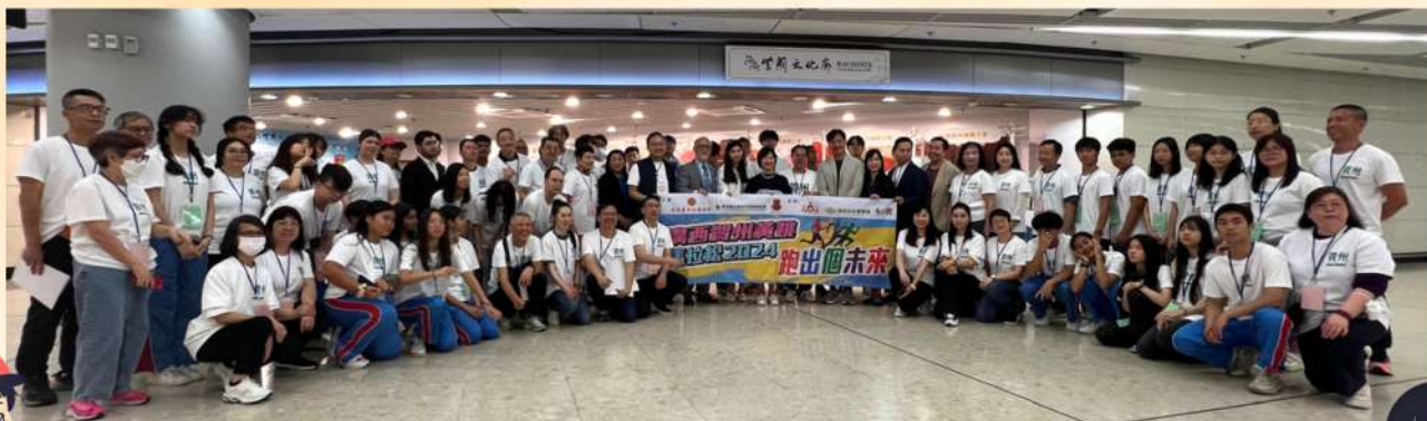
我們帶領40多名學生參與4月份在賀州黃姚古鎮舉辦的馬拉松賽事。