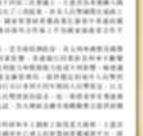
蔡嘉謙 全國政協委員、全國人口經濟發展委員會副主任、香港廣西社團總會副會長

【本報專訊】全國人口經濟發展委員會副主任蔡嘉謙日前在廣西考察期間，接受本報專訪。蔡嘉謙表示，總會一直以來都致力於促進香港與廣西兩地之間的交流與合作，並堅決支持中央政府的各項政策。她強調，維護國家安全是香港繁榮穩定的基石，也是香港融入國家發展大局的關鍵。大會還討論了總會未來的發展方向，包括加強與廣西各界的聯繫，推動兩地經濟、教育、文化等多領域的合作。