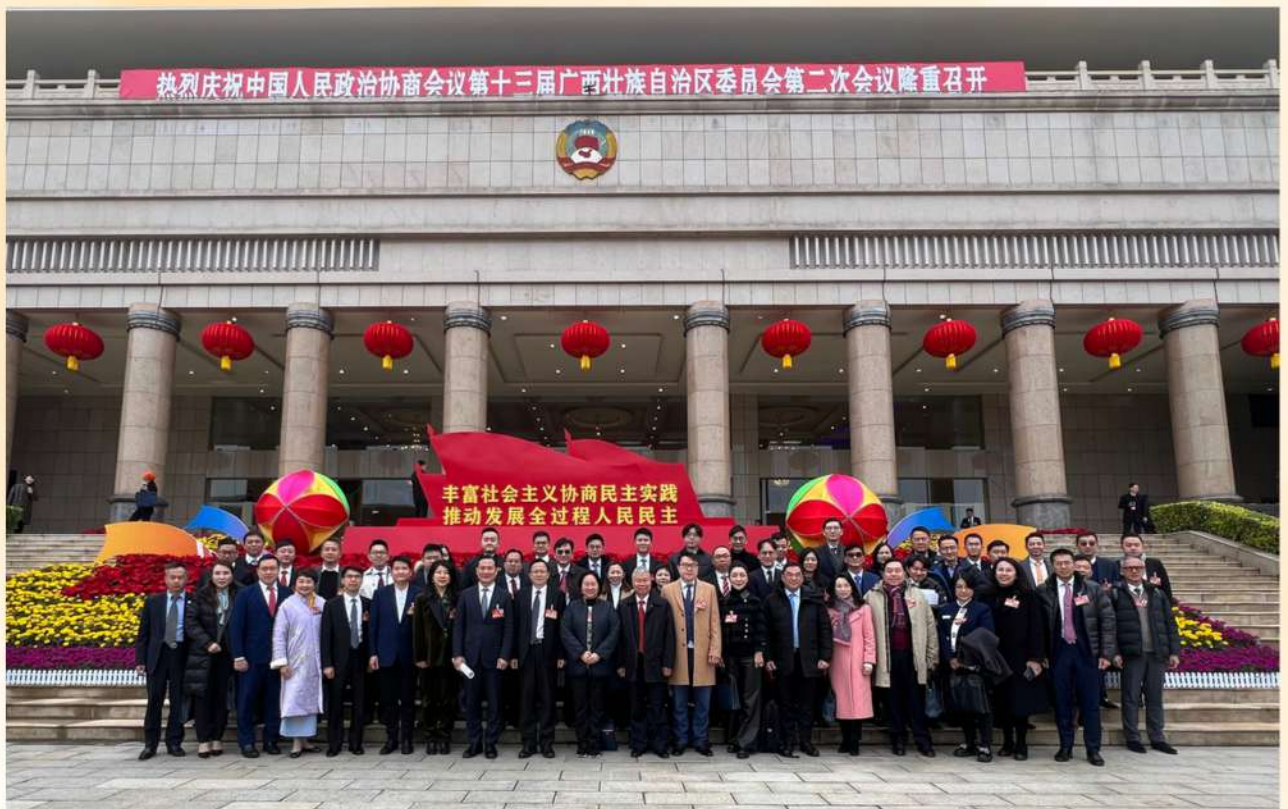
中國人民政治協商會議第十三屆廣西壯族自治區委員會第二次會議。身兼自治區政協委員的香港廣西社團總會成員在同心會堂前合照。