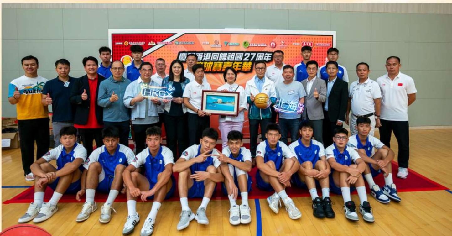
邀請廣西北海市第九中學的學生來香港參與「慶祝香港回歸祖國27周年 籃球賽嘉年華」，與香港多個青年團體和學校學生切磋球技，進行體育交流。