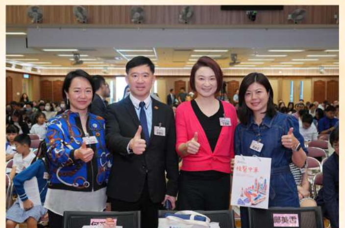
首屆情繫中華香港青少年作文暨朗誦大賽，其中發布了優秀作文選編收錄了400多篇參賽作品，希望與廣大讀者分享青少年真摯的愛國情懷。