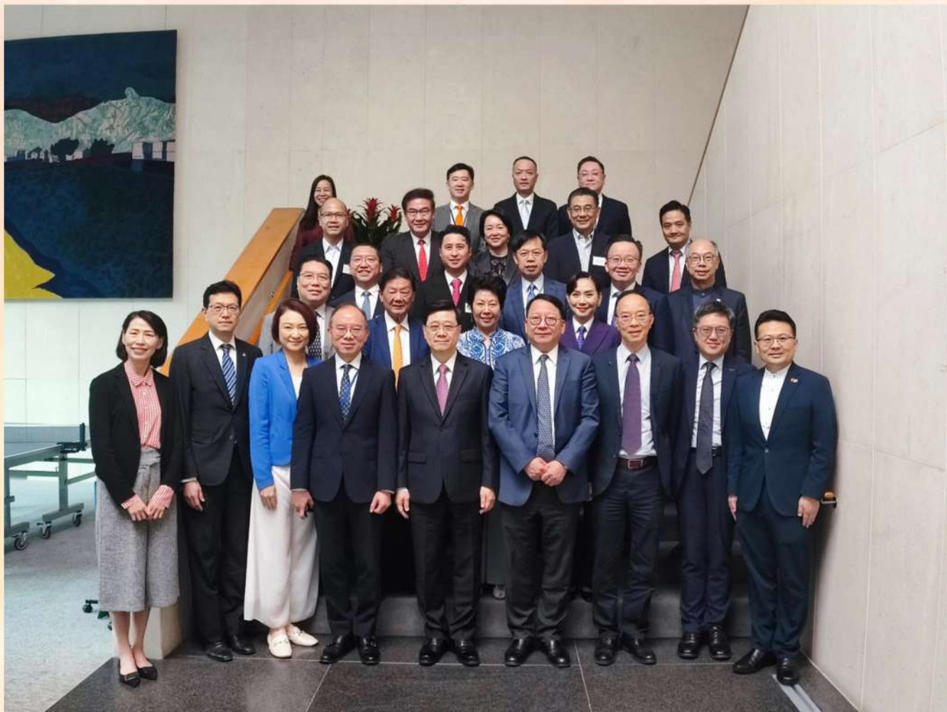
我們向特區政府新一份施政報告提出建議。